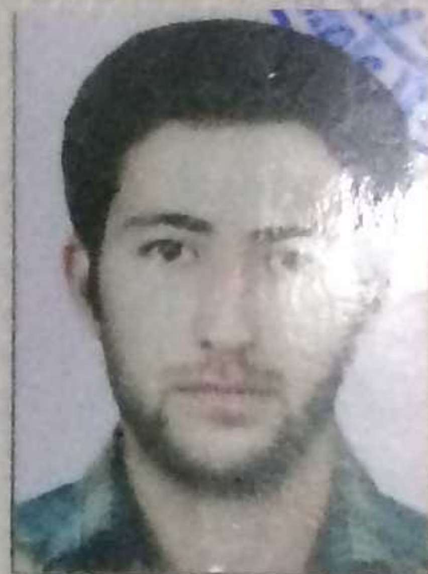
مرستیال / V-President

شرکت ساختمانی و سرکسازی ستاره سیول Civil Star Construction Company