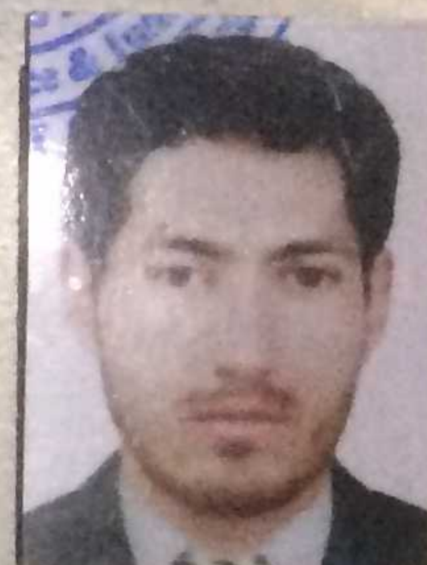
رئیس / President